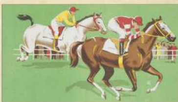
Course de chevaux - Illustration imprimée sur une boîte de jeu dans les années 30