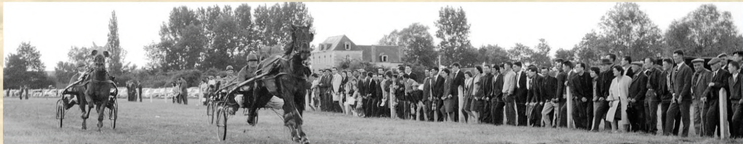
Les deux photos en longueur ont été prises par des photographes du Berry républicain. Celle du haut le dimanche 12 août 1962, celle du bas le dimanche 14 juin 1964. Souvenirs, souvenirs...

Archives municipales de Bourges - Fonds Berry républicain