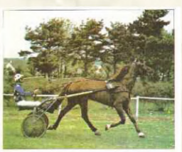
Demain à Lignières : soixante chevaux pour sept prix Chaque à leurs traits, obstacles, cavaliers et jockeys auront demain après-midi les sept courses, encadrées au programme de la seconde réunion hippique de Lignières. La première course sera lancée à 14 h 30 et une soixantaine de chevaux se disputent les sept prix. Soixante cavaliers pour les spectateurs. L'hippodrome a suivi une cure de jouvence. On attend plus que jamais.

Au milieu des années 80, les quotidiens régionaux se modernisent. Adieu le plomb, vive l'offset. Cette technique va permettre d'introduire la couleur dans le journal, pour la Une et pour quelques pages intérieures d'abord, puis au fil des décennies pour l'ensemble des pages du journal. C'est le cas pour Le Berry républicain qui change sa rotative... et de logo en 1985. Dès cette année-là, les courses de Lignières sont à la Une en couleur (ci-contre Une du 7 août 1985). Elles y seront régulièrement, comme par exemple sur cette édition du samedi 13 août 1988.